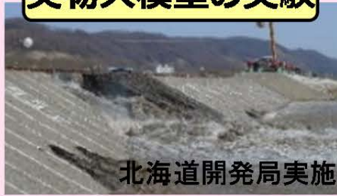
実物大模型の実験